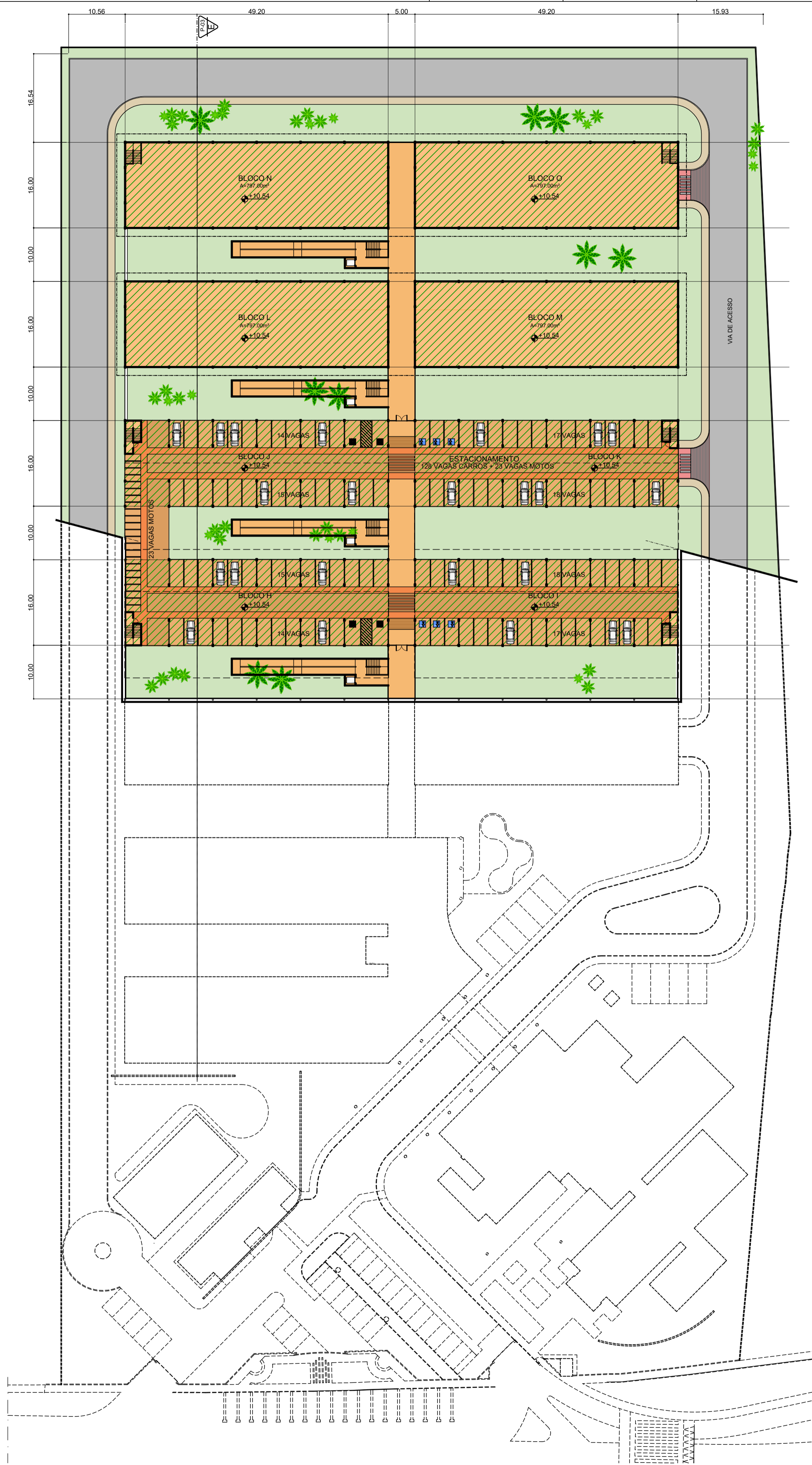
PLANTA GERAL - NÍVEL +10.54 ESCALA 1/500