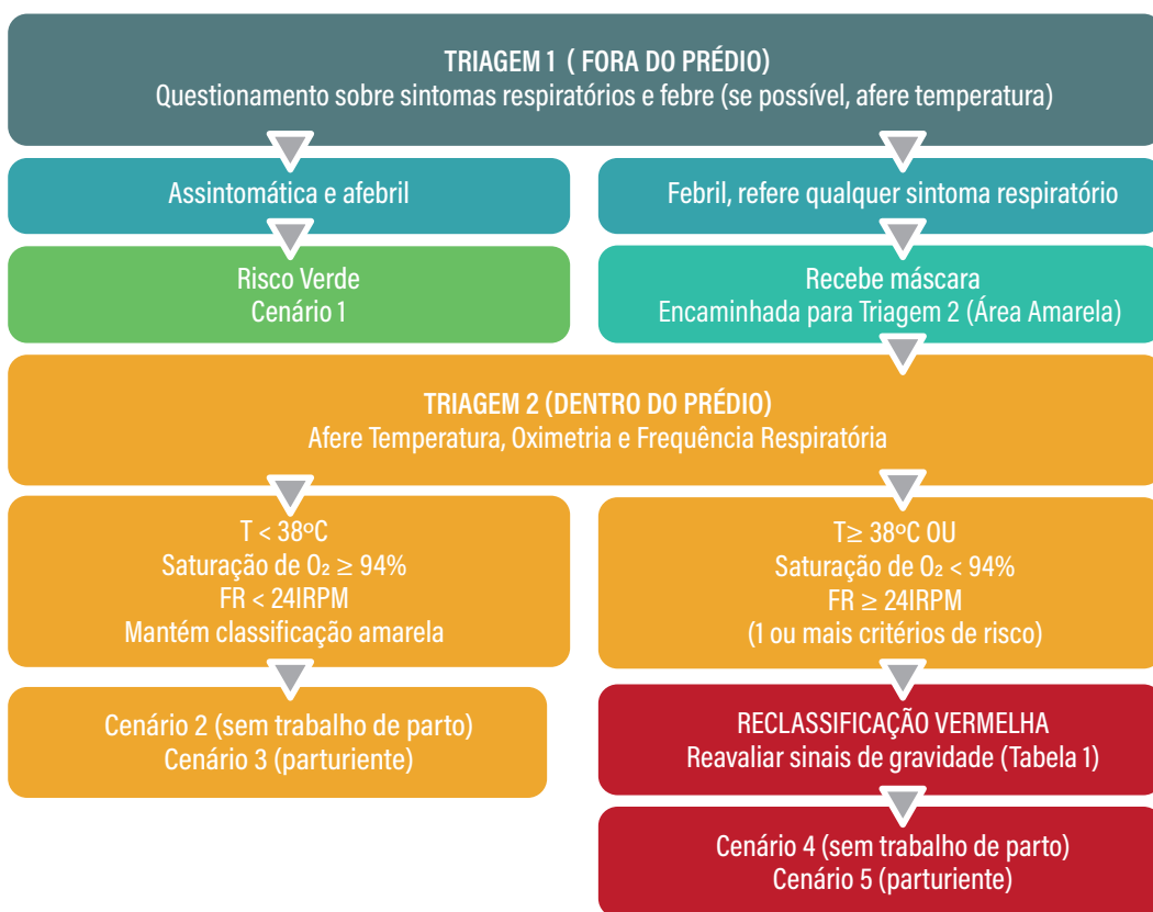
FIGURA 1 | Proposta de fluxo de atendimento para gestantes e classificação de cenários clínicos.

Uma proposta de fluxograma de atendimento é apresentada na Figura 1 .