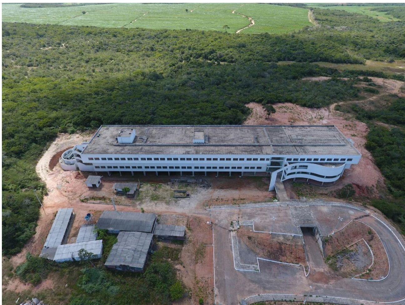
Centro de Pesquisa